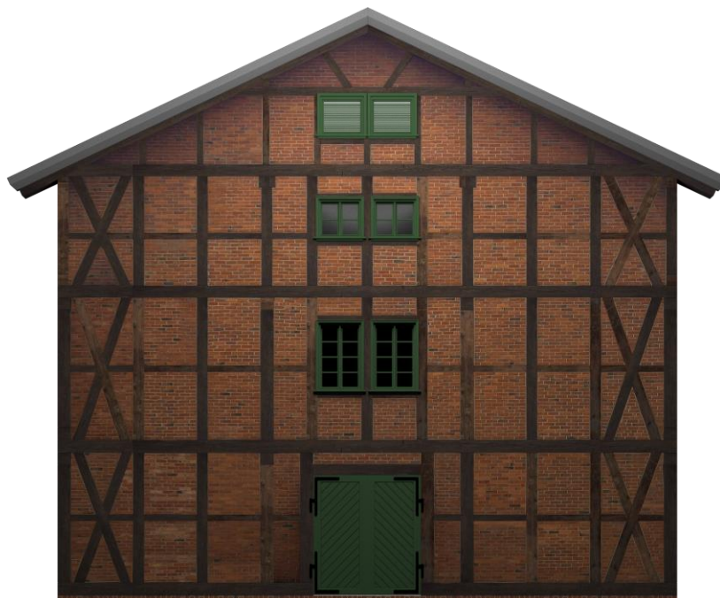
Rzut frontowej ściany w kolorze